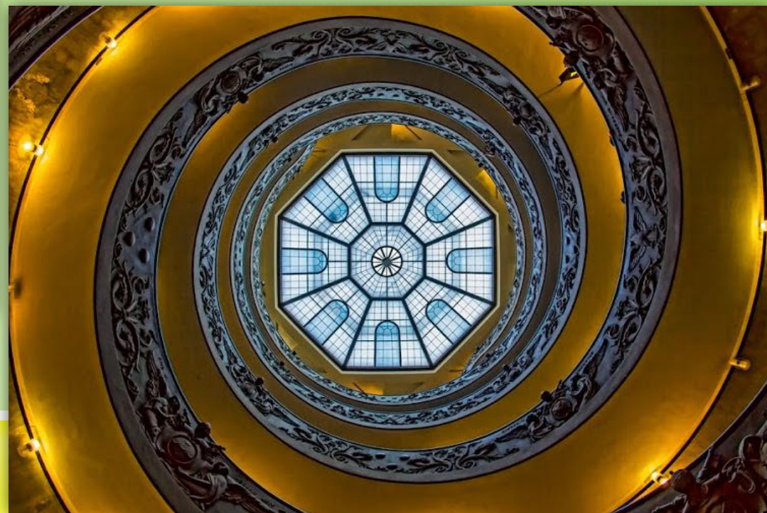
Scala elicoidale a doppia rampa. G. Momo, Musei Vaticani, 1932