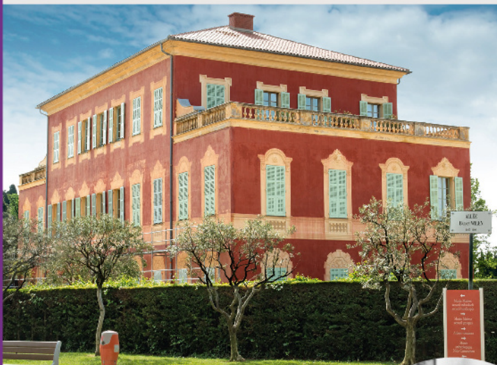
Les jardins de Cimiez.