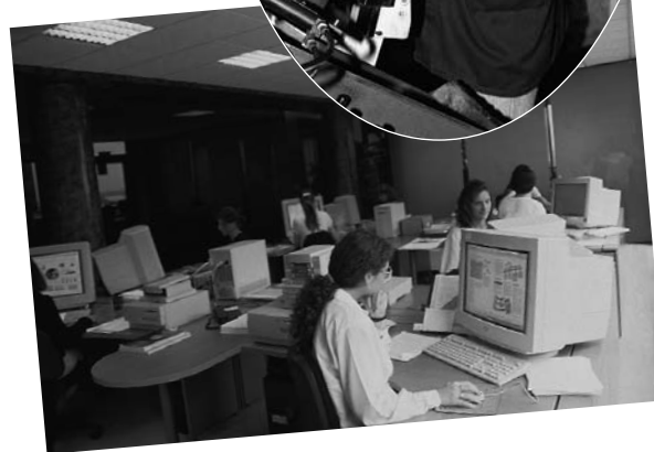
Il lavoro è un diritto e un dovere del cittadino.