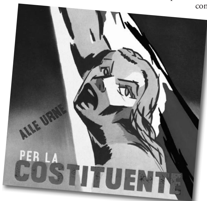
Un manifesto simboleggiante la neonata Repubblica, che invita il popolo alle urne in vista del voto per la Costituente.

Il testo fu approvato il 22 dicembre 1947 ed entrò in vigore il 1° gennaio 1948. Da allora, il panorama italiano si è modificato sostanzialmente, anche a causa del processo di unificazione europea e delle spinte economiche dovute al processo di globalizzazione. Si è avvertita, dunque, da più parti, un'esigenza di rinnovamento della Parte II della Costituzione, che è sfociata nel 2001 nella legge costituzionale n. 3 del 18 ottobre 2001. Questa ha portato all'abrogazione di 5 articoli del Titolo V e alla modifica di altri 14, senza peraltro provocarne uno stravolgimento. Le norme sono relative ai nuovi rapporti tra lo Stato centrale e gli enti locali: Regioni, Province, Comuni, Città Metropolitane.