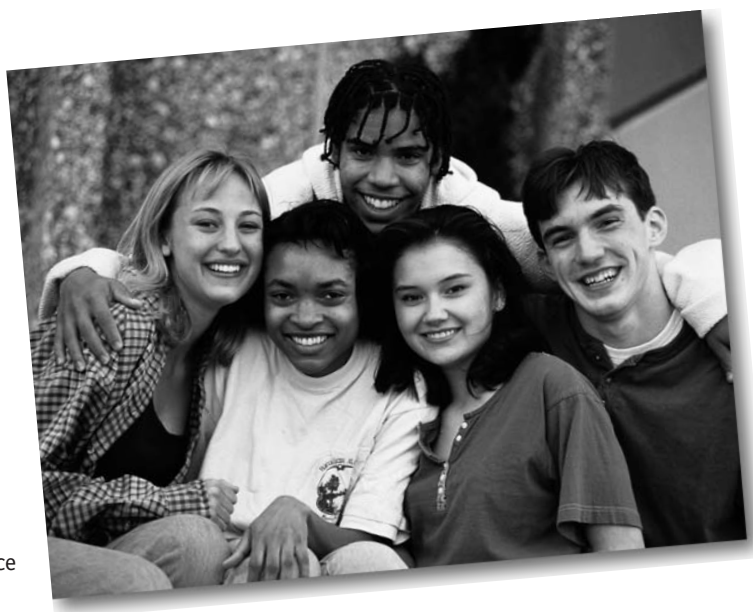
L'art. 3 della Costituzione riconosce il principio di uguaglianza.

Uguaglianza sostanziale. Nel secondo comma, partendo dal riconoscimento dell'esistenza di condizioni personali e sociali differenti, lo Stato si impegna in un compito di rimozione degli ostacoli all'esercizio pieno dei diritti di uguaglianza. Vi sono, infatti, cittadini ricchi o poveri, pienamente impiegati o disoccupati, sani o con impedimenti di tipo fisico o mentale. Sulla scorta di questo è inevitabile che ostacoli di tipo economico e sociale potrebbero frapporsi tra il cittadino e lo Stato, limitando fortemente la libertà e l'uguaglianza. Lo Stato deve quindi farsi carico di eliminare, attraverso apposite leggi, le differenze che possono crearsi tra i cittadini, favorendo, così, le classi sociali meno abbienti che, altrimenti, rimarrebbero tagliate fuori dalla vita dello Stato.