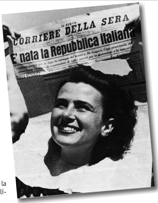
Esultanza per la vittoria repubblicana.

ricostruzione postbellica. Senza il contributo dei lavoratori non sarebbe stato possibile riavviare lo sviluppo economico e neppure dare prospettive agli individui, che dal lavoro traggono la loro principale fonte di sostentamento.