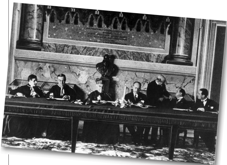
Il cardinale Gasparri e Mussolini firmano i Patti Lateranensi, 11 febbraio 1929.