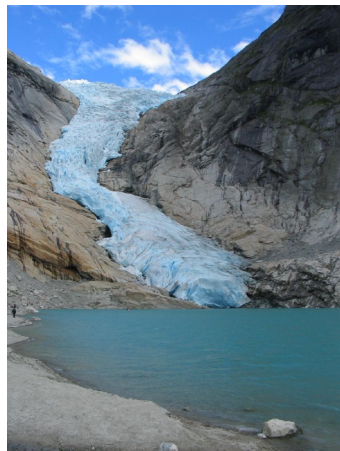
Ghiacciaio Briksdal (Norvegia), 2004-2007