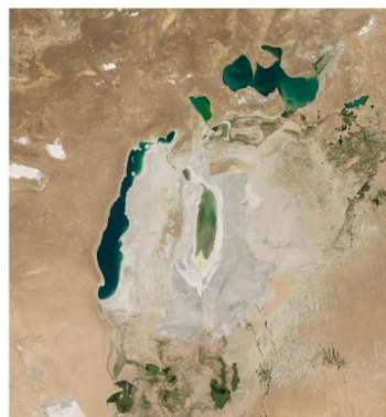
Lago d'Aral, 1965-2015