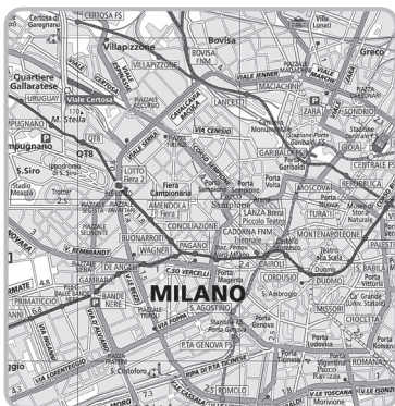
una carta topografica