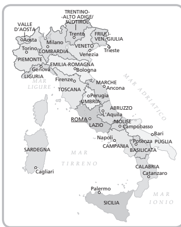
una carta geografica politica