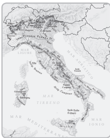
una carta geografica fisica