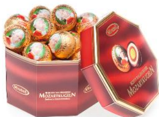
9 die Mozartkugel, -n