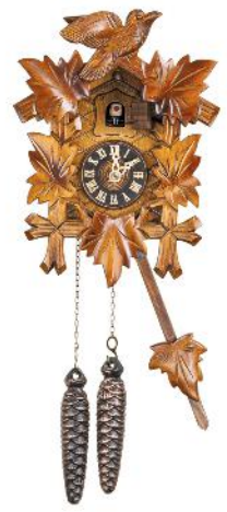
8 die Uhr, -en