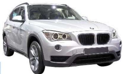
4 das Auto, -s