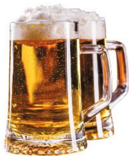
7 das Bier