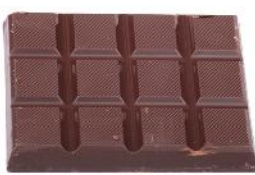
6 die Schokolade