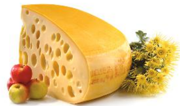
2 der Käse