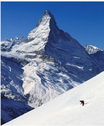
1 das Matterhorn