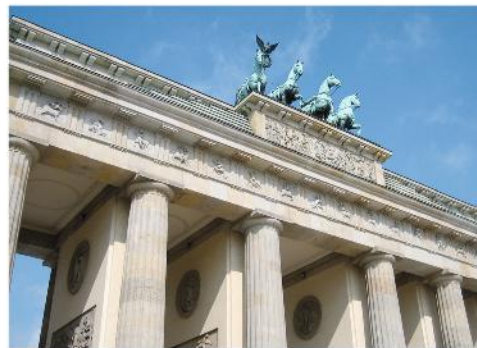
10 das Brandenburger Tor