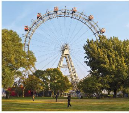
5 das Riesenrad