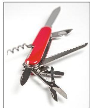
3 das Taschenmesser