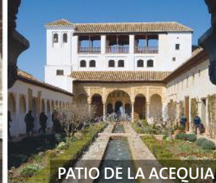
PATIO DE LA ACEQUIA