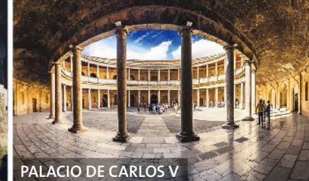
PALACIO DE CARLOS V