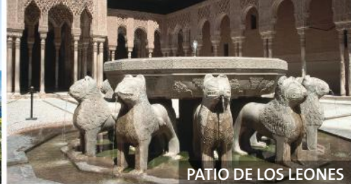
PATIO DE LOS LEONES