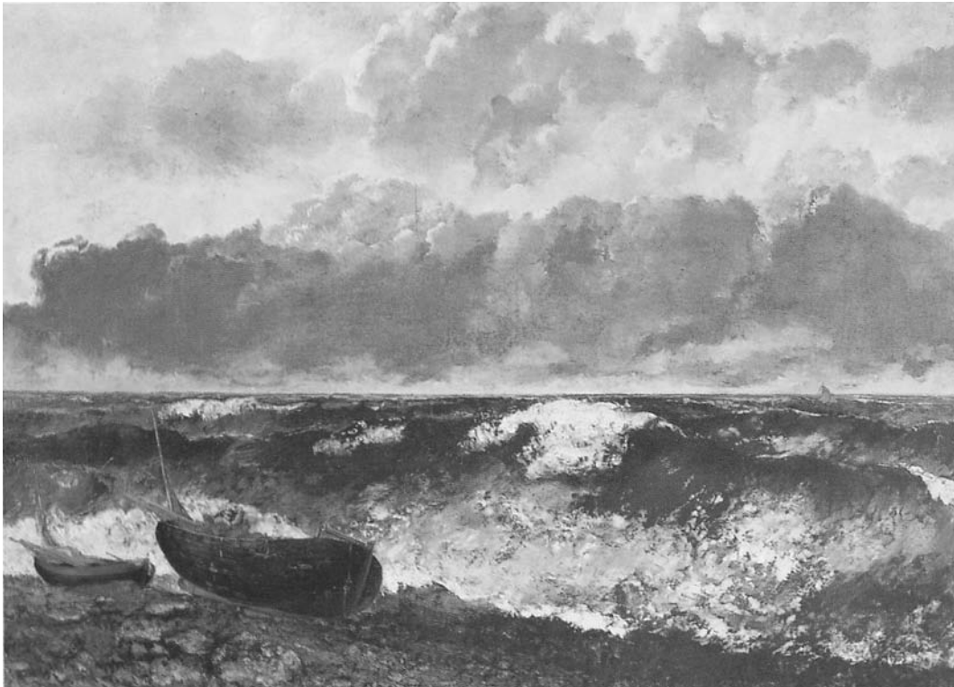
Courbet, L'onda , 1869