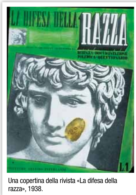
Una copertina della rivista «La difesa della razza», 1938.

vimento fascista. Pesavano, infatti, i nuovi miti imperiali della purezza della razza italica e la volontà sempre più decisa di sradicare ogni tipo di diversità e distinzione all'interno della società italiana. Di conseguenza, il regime mal sopportava l'autonomia mostrata dalla comunità ebraica che intervenne, per esempio, in favore degli ebrei tedeschi perseguitati dal nazismo. Minor peso in questa accentuazione delle politiche razziste e antisemite del fascismo ebbe il rafforzarsi del legame con la Germania hitleriana dato che Mussolini in quegli anni si mostrava ancora molto indipendente dall'alleato tedesco.