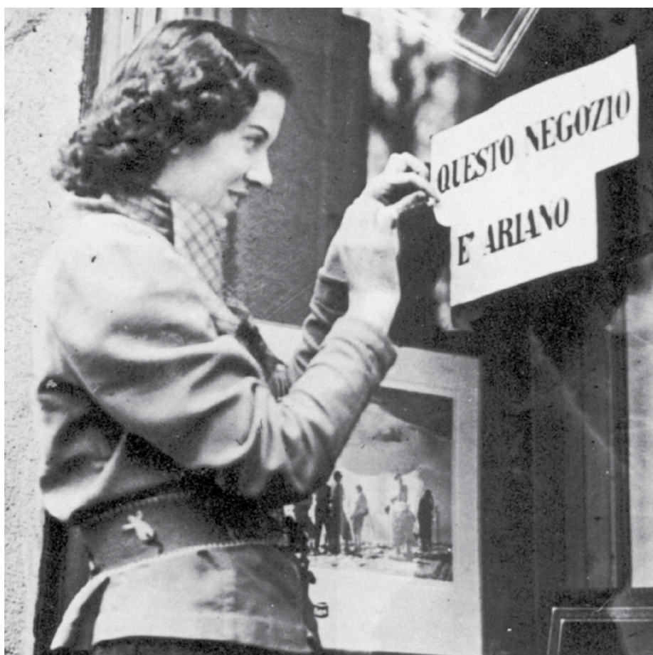
Una commerciante affigge sulla vetrina del proprio negozio un'insegna antisemita, Roma 1938.