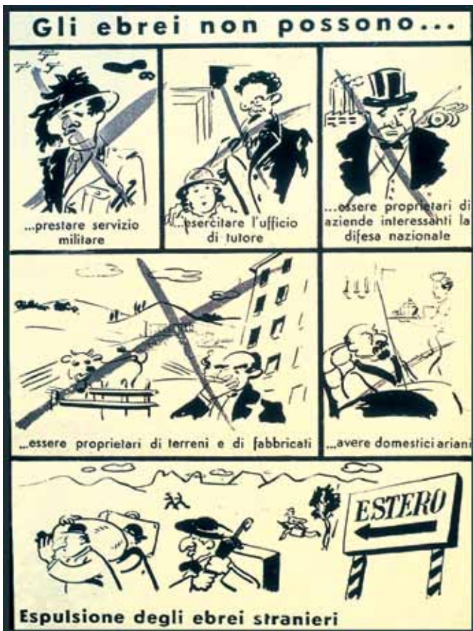
Vignette di propaganda a sostegno delle leggi razziali, 1938.

va tra italiani ed ebrei. Il 14 luglio 1938 venne ultimato il documento teorico Il fascismo e i problemi della razza (o Manifesto degli scienziati razzisti ) all'interno del quale si negava esplicitamente l'appartenenza degli ebrei alla razza italiana, definita di origine ariana e di civiltà ariana: « Gli ebrei rappresentano l'unica popolazione che non si è mai assimilata in Italia perché essa è costituita da elementi razziali non europei, diversi in modo assoluto dagli elementi che hanno dato origine agli Italiani ». 2