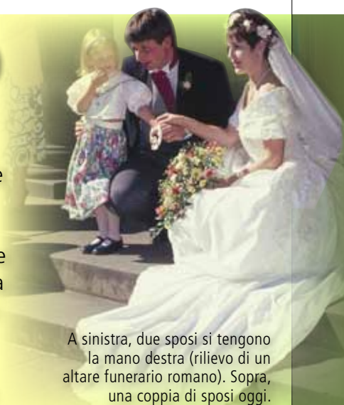
A sinistra, due sposi si tengono la mano destra (rilievo di un altare funerario romano). Sopra, una coppia di sposi oggi.

L'amore costituisce una componente fondamentale della nostra esistenza. L'idea di vivere senza affetti appare agli uomini e alle donne di oggi intollerabile. Ma non è sempre stato così. L'idea che ci si debba sposare per amore è, infatti, abbastanza recente, poiché si è diffusa in Europa solo a partire dai secoli XVIII e XIX. In questo percorso cerchiamo di capire l'evoluzione del rapporto tra amore e matrimonio nell'antichità e nel Medioevo.