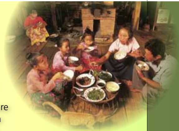
A sinistra, un aristocratico partecipa a un banchetto ascoltando la musica di un giovane flautista (pittura del V secolo a.C.). Sopra, pranzo in famiglia in una casa di Manjinbao, in Cina.

Mangiare è un atto biologicamente necessario alla nostra sopravvivenza. Quando mangiamo, però, oltre a soddisfare un'esigenza fisica, cerchiamo di appagare il gusto, cioè di provare piacere nell'ingerire certi cibi. Vi è anche una terza funzione svolta dall'atto alimentare: lo "stare insieme". In che cosa consiste questa funzione? Perché è anche oggi così importante, oltre ad esserlo stata nel passato?