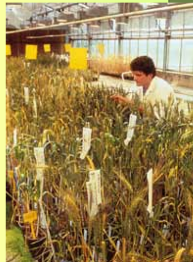
A sinistra, giovani che eseguono la raccolta delle olive (anfora del 530 a.C. ca.). Sopra, un biologo al lavoro.

Quando parliamo di alimentazione, sempre più frequentemente distinguiamo i cibi prodotti in modo naturale da quelli frutto di manipolazioni che ne hanno modificato, in modo più o meno profondo, le proprietà originarie. È corretta questa distinzione? A quando può essere fatta risalire? È difficile elaborare una risposta a tali domande, soprattutto se pensiamo che l'uomo è sempre intervenuto sulla natura per aumentare la quantità o migliorare la qualità dei prodotti destinati all'alimentazione, ma che gli interventi di modificazione genetica realizzabili attualmente non hanno precedenti nel passato.