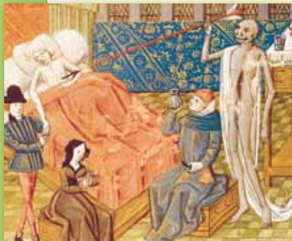
Sopra, la morte di un giovane colpito dalla peste (miniatura del XV secolo). A destra, una scuola per ostetriche a Kolkata, in India.