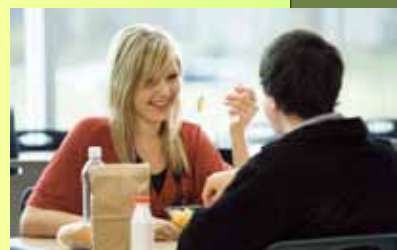
A sinistra, la cena romana. Sopra, due giovani pranzano in un fast food .

Quando si parla di gusti alimentari, generalmente si sostiene che ciascuno ha un proprio orientamento personale e che non è possibile individuare punti di vista comuni. Ma le cose stanno veramente così? Non è, invece, vero che esistono, anche in questo ambito, atteggiamenti comuni? Ogni popolo ha le sue tradizioni alimentari, ma la storia dell'alimentazione ci insegna che i nostri gusti in fatto di cibo sono il prodotto di una lunga evoluzione e dell'incontro tra civiltà e stili di vita diversi.