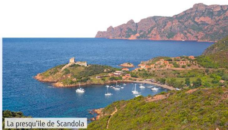
La presqu'île de Scandola

Bonifacio, la cité des falaises, s'étend sur 120 km de côtes et possède de nombreuses plages aux eaux cristallines. La «sentinelle de la Méditerranée» est située sur de hautes falaises calcaires âgées de 25 millions d'années et sculptées par la mer. La ville médiévale aux ruelles étroites et pleines de charme