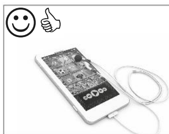
5 MP3 player